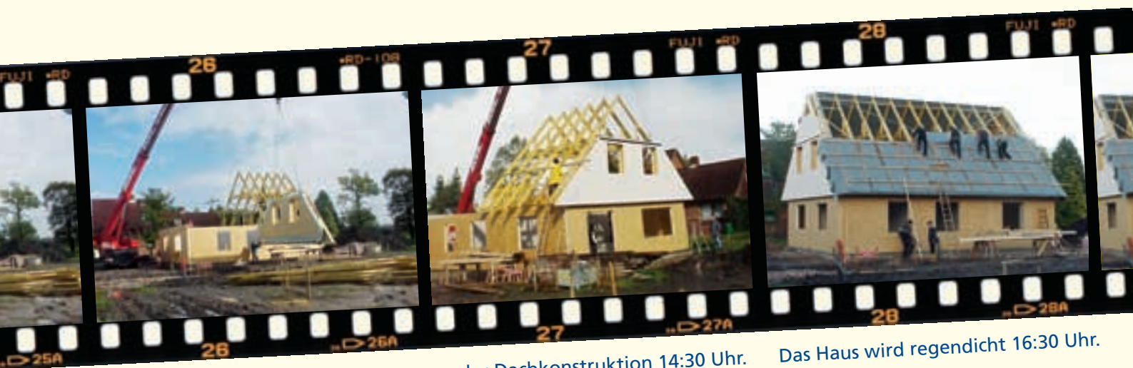
...der Giebelelemente 13:30 Uhr