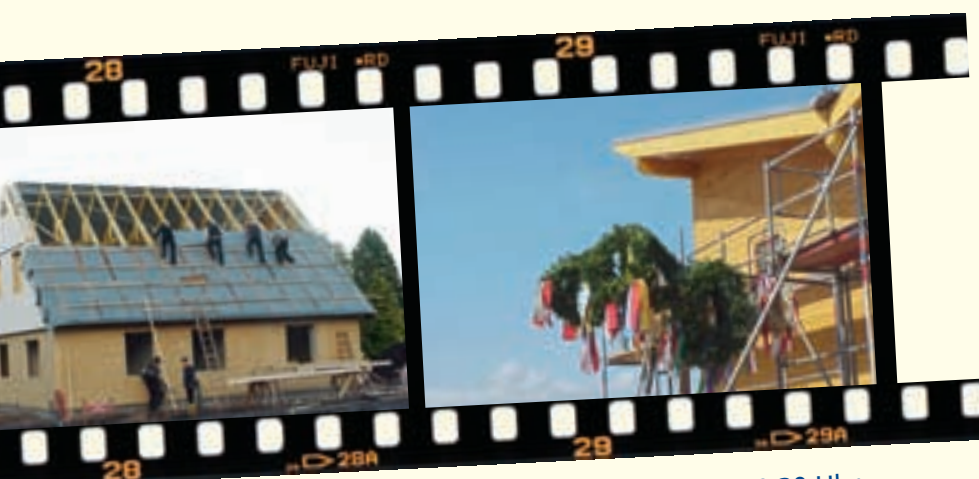
Richtfest im Trockenen 19:30 Uhr.