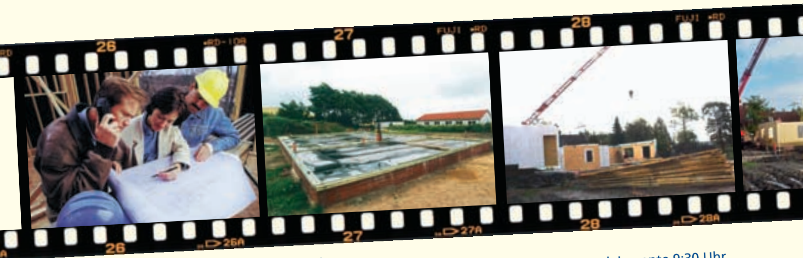
Einweisung der Zimmerleute 06:00 Uhr.